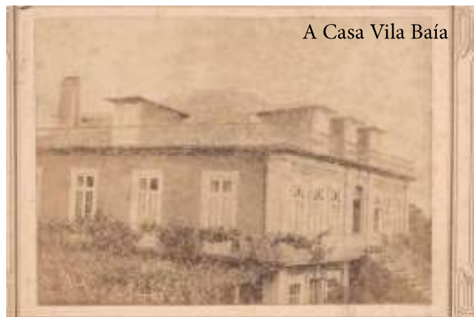
A Casa Vila Baía

Descanse em paz o nosso querido e chorado amigo de tão abençoada memória.”